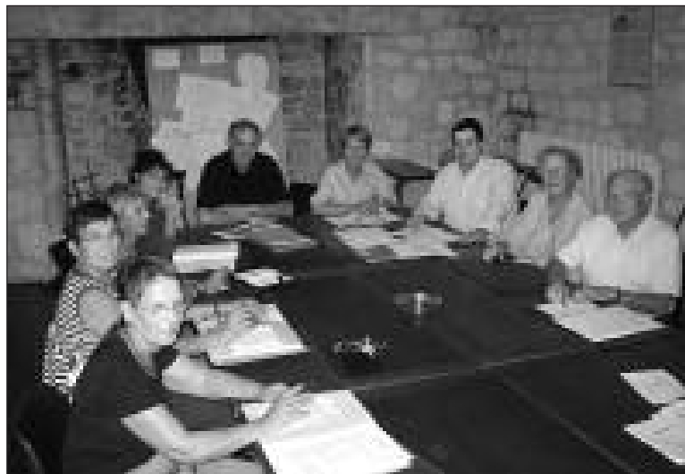
Le bureau de l'association Le Capiol

Il faudra encore un peu de patience à tous ceux qui attendent la sortie de l'histoire de Cénac et Domme. L'ouvrage est actuellement sous presse et comprendra 304 pages, largement agrémentées de photos anciennes, de tableaux, dessins et lithographies inédits de Lucien de Maleville et de photos couleur.