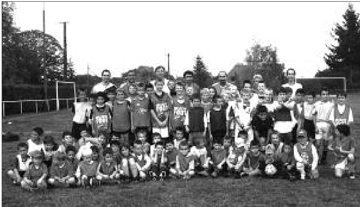
Les équipes U9 et U11 lors de l'entraînement

Samedi 10 octobre, les U11 participaient au plateau de Daglan. L'équipe Arsenal gagne deux matches, la Barcelone ramène une victoire et un nul et la Chelsea revient avec un nul et une défaite.