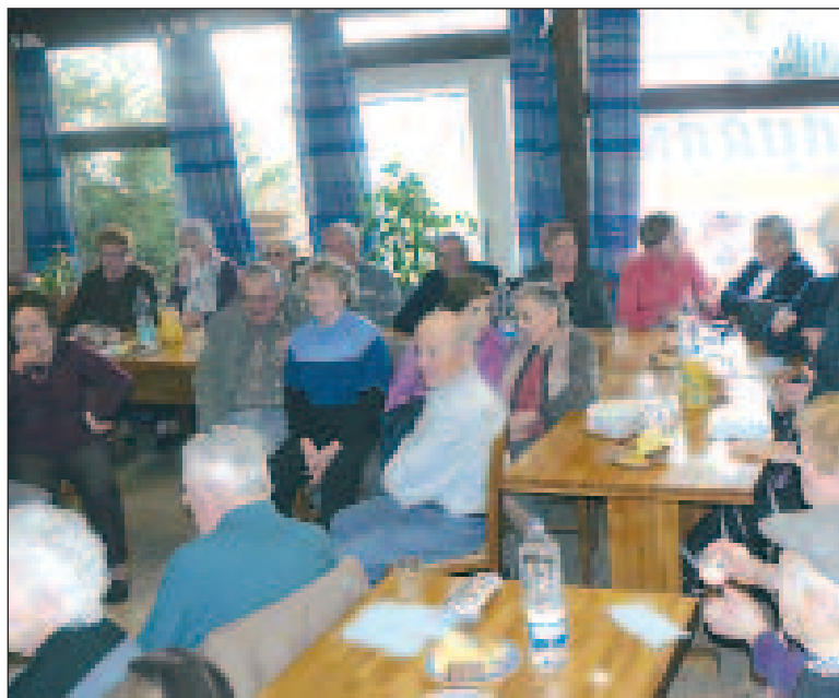
Un goûter qui rassemble