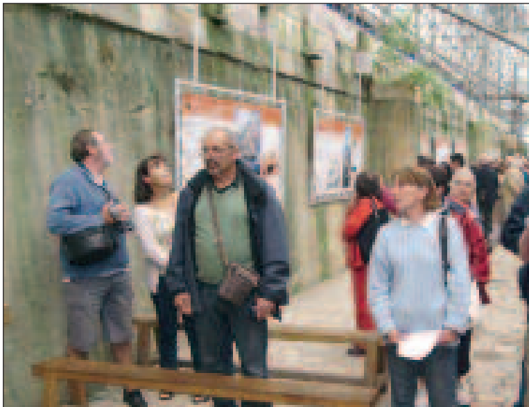
Soleil, visites et détente... de vraies vacances !